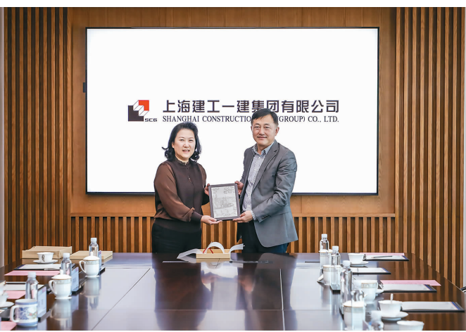
集团召开2024年青年项目经理座谈会

三是抓好经济运行质量,对经济运行要全面把握和管控,做到心中有数,心中有数;大力培育在全生命周期可发展的新兴业务;要向科技、资源、管理、改革要效益,要大胆改革、自主改革。对于明年工作,杭迎伟指出,要切实做好形势研判,科学合理谋划思考,主要领导要有改变局面、推动发展的决心。会上,徐颢就一建集团全年经济运行情况及明年工作总体设想等作了详细汇报,与会领导结合各自分管领域、分管工作作了补充发言。