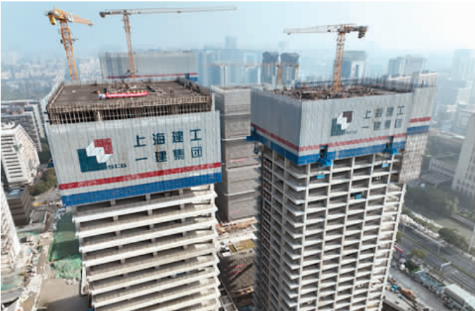
通视,能今年6月商业用房、10月C01塔楼成功封顶后,集团总包色彩的南京金融城三期东区项目首次技术新道具,152米高的A10塔楼顺利实现结构封顶!该工程建筑面积约31.3万平方米,地下2层,地上包括4栋超高层建筑(最高200米)和6栋多层商业建筑,汇聚超办公、现代商业、甄选酒店等多元业态,将打造成为南京区域金融中心核心功能载体和城市地标。

在苏河湾项目的建设过程中,商务管理工作贯穿开工与竣备的整个施工过程,做到了项目的“全过程”记录,为实现后期的风险规避及主动索赔奠定了坚实基础。例如在46-02塔楼费用补偿上,由于施工图纸与投标图纸存在差异,塔楼核心筒分布分散,无法用常规木模施