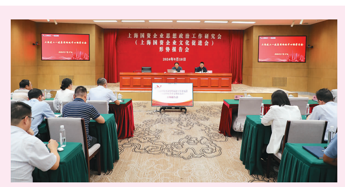
9月18日,集团结合承办市国资委思研会形势报告会,举行集团两级中心组学习会,邀请市委二十届三中全会精神专家宣讲团成员、市委组织部原副部长冯小敏就深入学习贯彻党的二十大精神作专题辅导报告。

本报讯(特约记者 褚兰萍)集团党委书记、董事长杭迎伟在9月29日上海建工城市更新论坛上致欢迎词时表示,城市是有机生命体。城市更新,一头连着发展,是城市发展的先行者,上海建工将深入践行人民城市重要理念,深刻把握城市更新丰富内涵,在规划、投资、设计、建造、更新、运维等全生命周期服务能力的联动集成上与同行俱进,在项目组织、企业管理、科技赋能、人才培养、业务模式等方面的变革创新上因时而变,为探索可持续发展城市更新之路提供高效、专业、系统的“建工方案”。