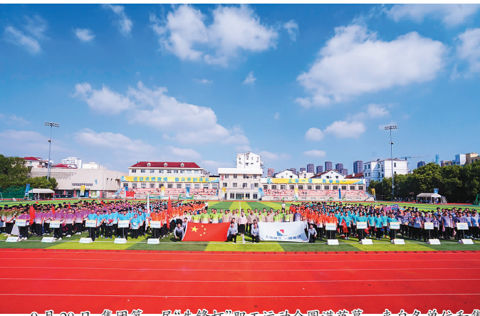
9月28日,集团第一届“先锋杯”职工运动会圆满落幕。来自各单位和集团总部13支运动代表队、近900名运动员参与当日的各项比赛和闭幕仪式。本次职工运动会由系列赛事组成,自4月开幕以来,先后举行了羽毛球、篮球、足球、掷壶、电子竞技、田径、拔河、长绳等多项比赛,最终,