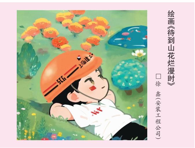
徐 鑫 鑫 安 装 工 程 公 司

傍晚时分,寻得一辆单车,我沿着宛陵湖畔悠然骑行。宛陵湖,这颗镶嵌在宣城大地上的璀璨明珠,