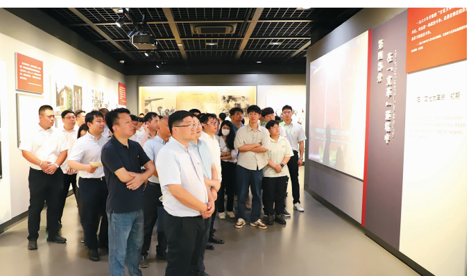
7月6日,市政工务公司党员开展了“传承红色基因,传承红色血脉”主题党日活动,组织全体党员赴陈云纪念馆参观学习,教育引导党员们感悟初心使命,锤炼党性修养,激发工作干劲。