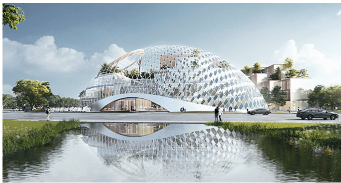
近日,集团与无锡城投天奇设计有限公司组成联合体中标了由无锡恒元置业公司建设的XDG-2021-11号地块建设项目,为无锡市首个近零能耗建筑。该项目位于无锡市经开区,总建筑面积54711.64m 2 ,中标价5.54亿元,由展示馆、办公楼、低密商业街区等共计12幢建筑物组成;另有新建河道(约220m)从本项目内穿越,并设有2座桥梁。(通讯员 周帅印报道)

除了被动适应气候和场地条件,集团还通过主动的高效能源管控,可再生能源利用,对建筑节能进行平衡和替代,从而达到近零能耗。太阳能光伏发电。每栋单体屋面安装分布式太阳能光伏发电系统,该系统为并网发电,实现即发即用。共计安装876块多晶硅组件,装机功率高达324.12kWp,预计首年发电量约33万kw·h,可实现每年节约