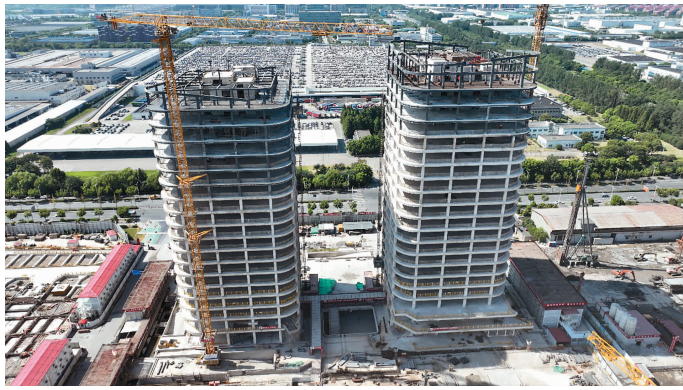
8月7日上午，随着最后一根钢梁安装就位，上海金鼎商业综合体核心四地块之一的全鑫20-01地块办公和商业新建项目顺利实现外框钢结构封顶。

严格落实管控措施。项目部严格执行“十达标、两承诺、一公示”文件要求，现场设置6米高硬质围挡和10米高雾炮喷淋系统；扬尘在线监