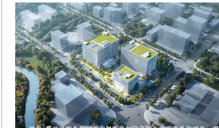
近日,第三工程公司顺利中标融创创研集团全球研发总部项目。项目总建筑面积约4.87万平方米,包括一栋10层研发楼及一栋6层综合楼,工程造价约2.66亿元,计划工期620天。(通讯员 史皓勇 报道)

集团党委书记、董事长徐颢向新员工的到来表示热烈欢迎,并提出三点希望:一是葆有对企业的忠诚,对工作的负责,对学习的热爱。要忠于企业、尽责工作,与企业同向同行;要虚心好学,不断学习新知识、新技术,紧跟行业发展步伐。二是脚踏实地,勇于到艰苦环境经受历练。要主动扎根区域市场、重大工程第一线接受考验、磨砺意志,提升本领;要弘扬“奋斗者精神”,脚踏实地,成长为复合型人才。三是守制度、讲规矩,快速融入新的团队。要增强纪律意识,加强沟通协作,充分发挥团队的重要作用;要强化纪律意识、规矩意识,自觉遵守企业各项规章制度,系好人生的第一粒扣子。