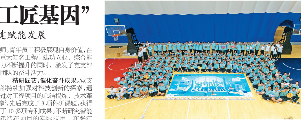
7月28日，186名优秀毕业生汇聚上海一建，开启了封闭式入职集训。图为新员工素质拓展活动——挑战哥德堡多米诺搭建，诠释新员工眼中的“奋斗者精神”。

集团西南赛区“双献五小”活动已连续开展7年。近年来，各参赛单位将“智慧建造”理念融入工程实践中，积极探索无人机应用、