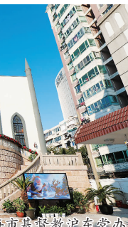
项目周边环境复杂，西侧、南侧均为已建建筑，现场场地狭窄，西侧基坑边距建筑物2.5米，无法设置道路；南侧为信通院精密仪器厂房，道路宽度仅有3米，现场无法形成行车环路，对现场施工进度造成较大影响。

项目周边环境复杂，西侧、南侧均为已建建筑，现场场地狭窄，西侧基坑边距建筑物2.5米，无法设置道路；南侧为信通院精密仪器厂房，道路宽度仅有3米，现场无法形成行车环路，对现场施工进度造成较大影响。项目部进场后充分利用场地资源，提前进行设计图纸深化，通过增减栈桥布置，保证了现场行车环路，对现场施工进度造成较大影响。