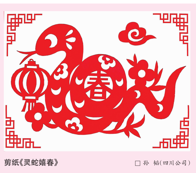
剪纸《灵蛇嬉春》 □ 孙楠(四川公司)