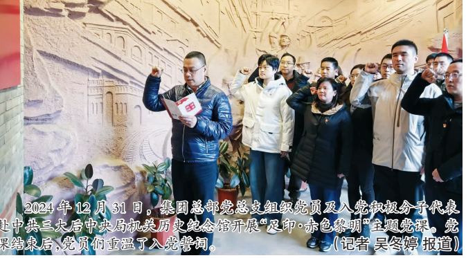
2024年12月31日，集团总部党委组织级领导及入党积极分子代表赴中共三大会址中央局纪念馆红色革命纪念馆开展“迎新·红色黎明”主题活动，重温党的历史，传承红色基因。(记者 吴冬婷 报道)