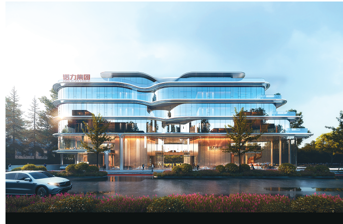
近日,第二工程公司顺利中标诺力集团上海总部项目。项目地处上海虹桥区域,总建筑面积约1.64万平方米,工程造价1.5亿元,计划工期630日历天。项目主体为一栋5层办公楼,建筑高度约23.95米,共有两层地下室。(通讯员 王振鹏 报道)