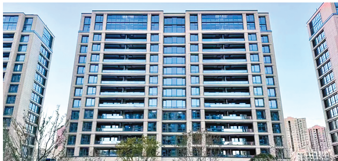
期间,由一建集团总承包的冷岛基地05-01地块建造新建项目顺利竣工验收。该项目位于浦东“金色中环发展带”,总建筑面积11.2万平方米,包含9栋超高层住宅、1栋会所及一座KT站。项目建成后,将进一步带动金桥周边的基础设施建设和配套设施的完善。

度预拱混凝土结构施工,并实现屋面无渗漏。针对项目数据采集分析系统对屏蔽外界电磁波的极高要求(参照GJB5792-2006,为C级标准),在采用刀插式屏蔽门的同时,对室内墙体、顶面和地面等部位采用板体致密坚固的钢板作为屏蔽壳体,对进入屏蔽室的各类电源容器,设置高性能电源滤波器减少杂乱信号干扰,并在主电源前端设置隔离变压器和UPS,保证电力的持续稳定供应。项目团队采用