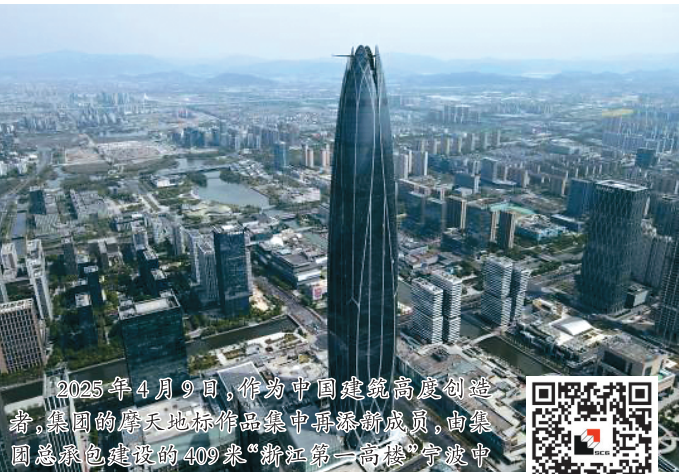
2025年4月9日,作为中国建设最高成就者,集团的摩天地标作品集萃中鼎集团成员,由集团总裁亲自带领的409名“新虹第一高楼”建设中心大厦正式交付启用!