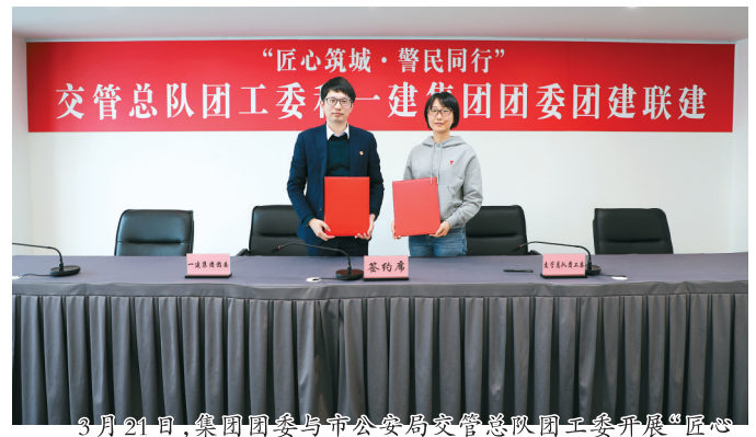
3月21日,集团团委与市公安局交警总队团委开展“匠心筑城·警民同行”党建联建活动,双方青年代表20余人参加。未来,双方将围绕团青活动、智慧交通、施工安全等领域开展常态化合作。

表的创新思路,强调需以实践淬炼本领,以实干践行责任,以科技驱动管控升级,以创新赋能高质量发展,为青年成长指明方向。 徐飏提出三点要求:一是要坚定信心,洞察市场形势,以主人翁姿态融入企业发展,实现个人成长与企业高质量发展双向奔赴;二是要持续学习,聚焦提升学习力、创新力、破局力,以创新思维和过硬本领突破发展瓶颈,打造核心竞争优势;三是要严于律己,坚守底线思维,以廉洁自律树立青春标杆,以勇攀第一的姿态为集团高质量发展贡献力量。